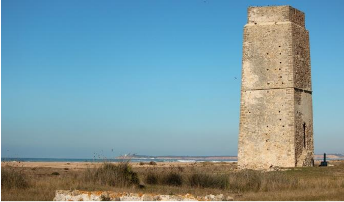
Foto: torre de Castilnovo.

La zona alrededor de la playa de Castilnovo es un lugar idóneo para los amantes de la naturaleza y la tranquilidad. Con más de 2kms de longitud esta playa une Conil con la playa del Palmar, que ya pertenece a Vejer de la Fra.